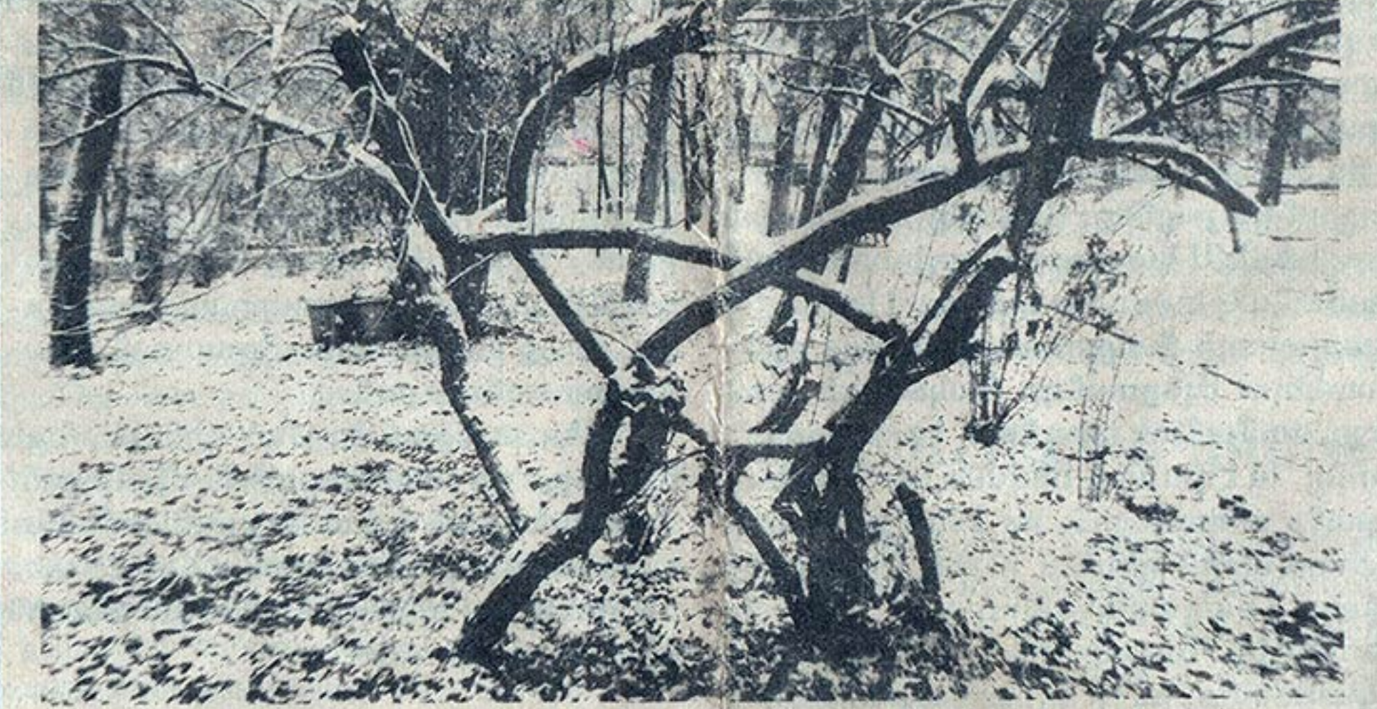
Ձյան խաղաղությունն անանգստ մեր կյանքում

- Փողոցում կամ տրանսպորտում որոշ տարածության վրա մարդկանց հետ առնչվելիս, ինձնից անկախ սկսեցի զգալ, որ նրանցից շատերը տառապում են այս կամ այն հիվանդությամբ. քիչ էր մնում մոտենալի ու հարցնելի, ասելը, ձեռքս լայրդը ձեռք չի՞՝ անհանգստացնում, կամ՝ լեղապարկում ծակոցներ չե՞ք զգում: Ես նրանց օգնելու պահանջ էի զգում: Առաջին մարդը, ում օգնեցի, մեր հարեանուհին էր, որը թունավոր «զոք» ուներ: Հիվանդությունն արդեն այն փուլում էր, որ բժիշկները չէին համարձակվում վիրահատել: Ես կարողացա հասնել այն բանին, որ ուռուցքը աստիճանաբար իջավ, եւ այն ի վերջո շատ հաջող վիրահատեցին: Հաջորդ հիվանդը արդեն տաս ամիս շաքարախտով էր տառապում: Առաջին իսկ սեանսից հետո շաքարը բավականին իջել էր: Իսկ 30 րոպեանոց ես երկու սեանսից հետո լիովին բուժվեց: Առաջին այս հաջողություններից հետո ինձ սկսեցին արդեն նոր մարդիկ դիմել, ու սկսեցի ինձ վստահ ու կարող զգալ: Մեկը բուժվեց հողացավից, մյուսը՝ ծակոցներից, երրորդի կարճատևությունն անցավ: Արդեն շատերին կարող եմ թվել, որոնք 1-3 սեանսի ընթացքում պատվել են իրենց հիվանդություններից: